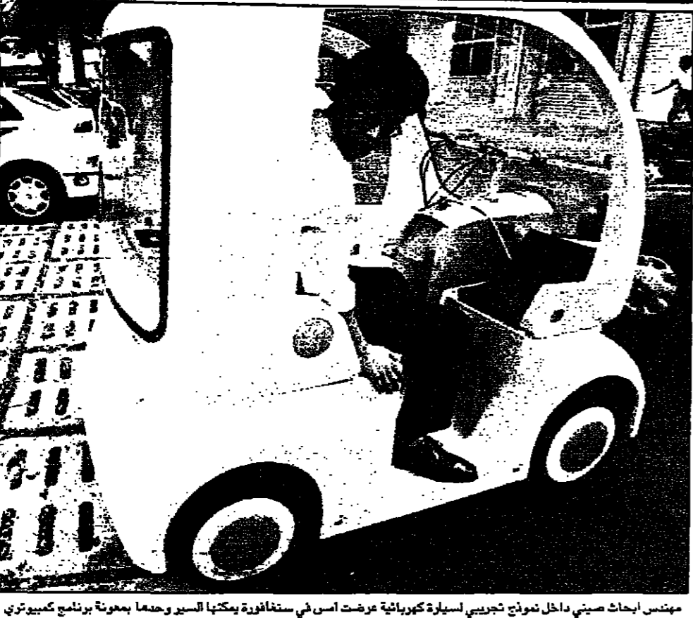
مهندس ابحاث صيني داخل نموذج تجريبي اسيرة كورباتي عرضت امس في سناغافورة بمكبها السير وحما بمعرفة برنامج كمبيوتر حسب التعليمات الشفهية للرجة لها. وقد طورت السيارة بمعرفة فرنسية من قبل باحثي جامعة سناغافورة لابحاث لتكنولوجيا